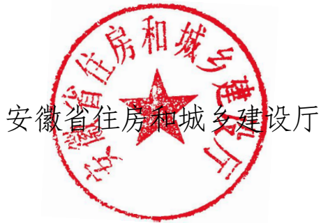
安徽省住房和城乡建设厅

求，结合我省实际制定《安徽省水电气网联合报装“一件事”工作实施方案》，现印发给你们，请认真组织实施。