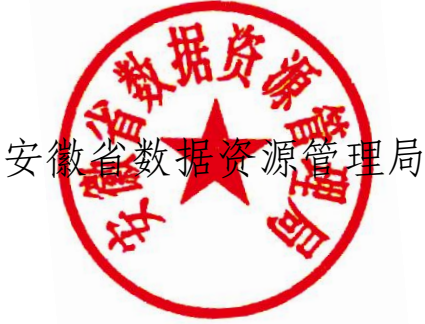
安徽省数据资源管理局