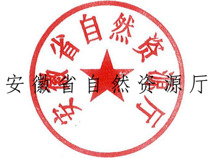
安徽省自然资源厅