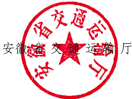
安徽省交通运输厅