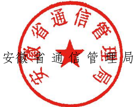
安徽省通信管理局